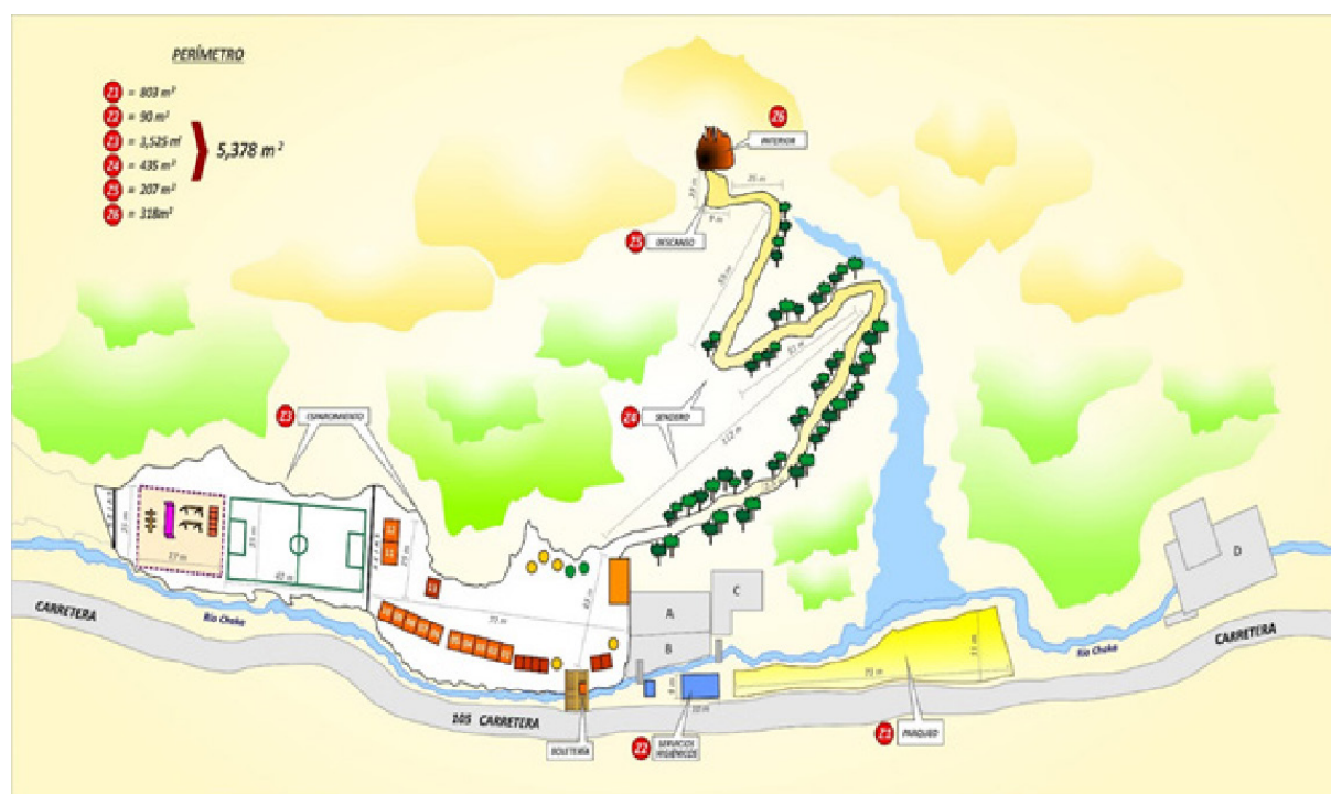
Zonas de distribución del atractivo

Nota. Z1: parqueo, Z2: servicios higiénicos, Z3: área de esparcimiento, Z4: sendero exterior (desde boletería hasta el ingreso a la gruta), Z5: área de descanso, Z6: sendero interior de la gruta.